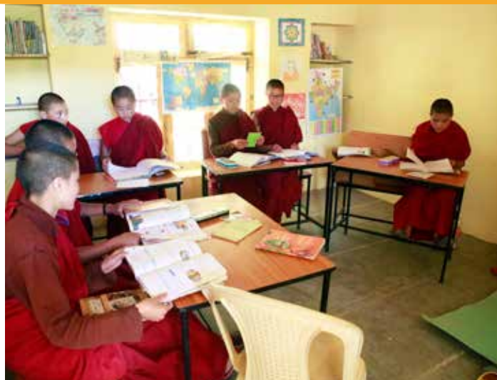
Klaslokaal Gephel nonnen in Basgo. Schoolmeubels gedoneerd door Stichting Educare