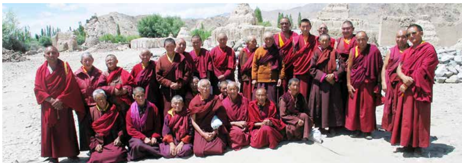
Nyerma in 2003

Nogmaals, ook namens 'onze nonnen', hartelijk dank voor uw steun.