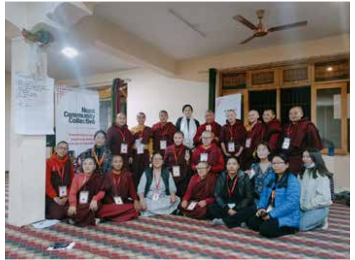
Workshop tegen geweld maart 2022

De Ladakh Nuns Association (LNA) is de grootste en oudste van de drie nonnenkloosters die we steunen. In 2022 vonden er weer veel activiteiten in én buiten het klooster plaats. De nonnen zijn niet alleen in de vertrouwde kloosteromgeving bezig met het vergaren van kennis en inzichten over de boeddhistische leer en met regulier onderwijs, maar ze passen het ook toe in de maatschappij - bijvoorbeeld door het verstrekken van medische zorg, dharma-onderwijs voor leken, of puja's bij ziekte en dood. Nuchter, praktisch en liefdevol staan ze met 'beide voeten op de grond en het hoofd in de hemel'. Ze zijn een voorbeeld van het toepassen van compassie en mededogen in het dagelijks leven. Maatschappelijk geëngageerd boeddhisme, zoals ze het zelf noemen. We geven hier graag een fotocompilatie van.