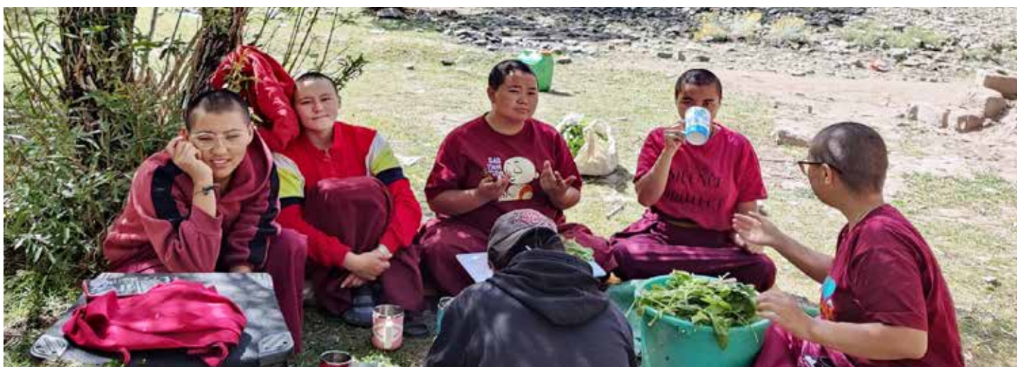
Picknick september 2022