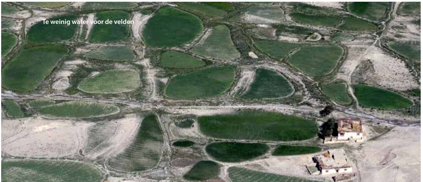
Te weinig water voor de velden