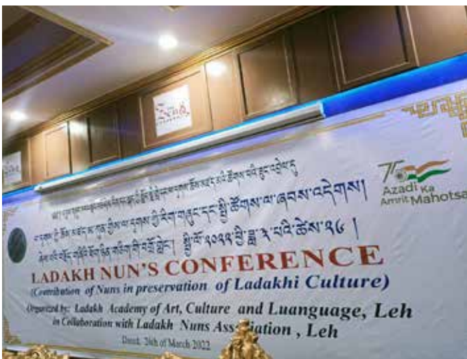
Conferentie over Ladakhi Cultuur maart 2022