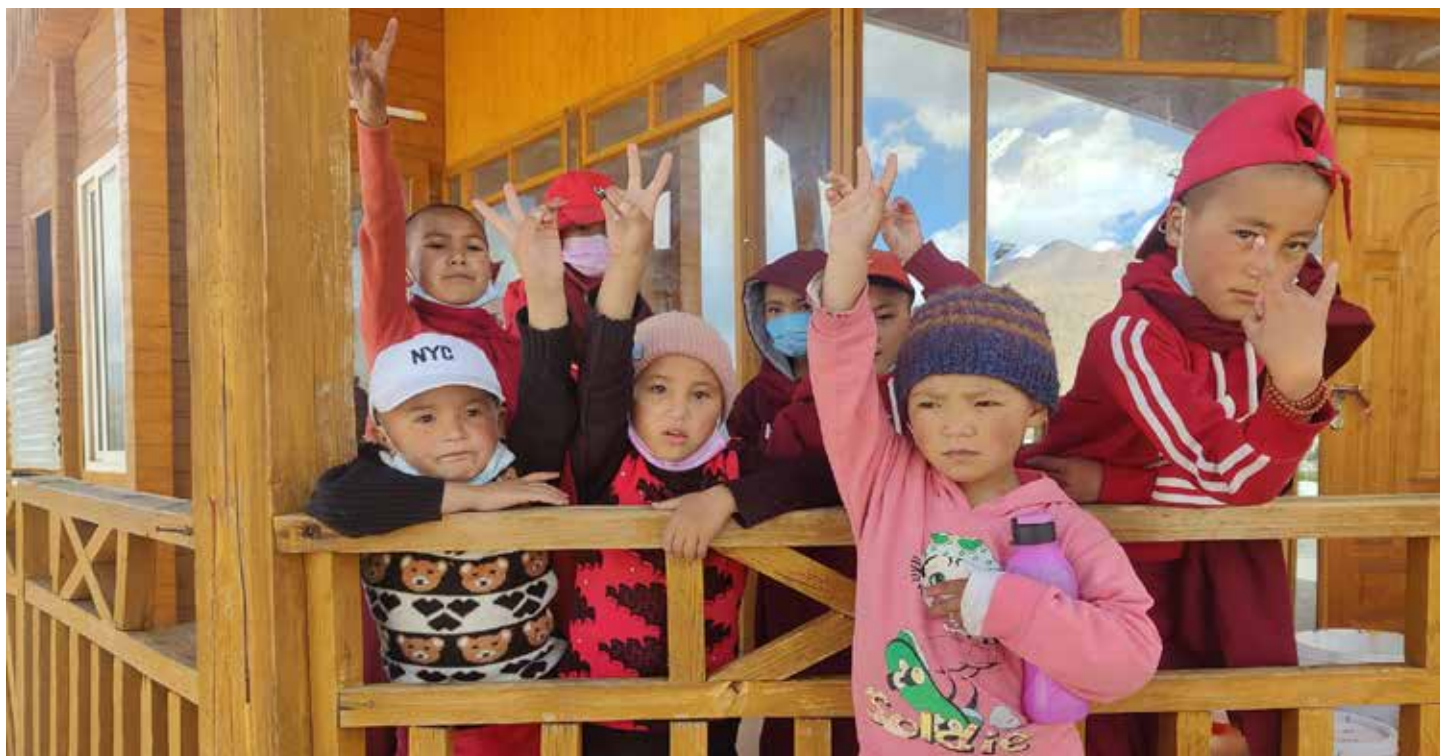
Wheel of Dharma juli 2022