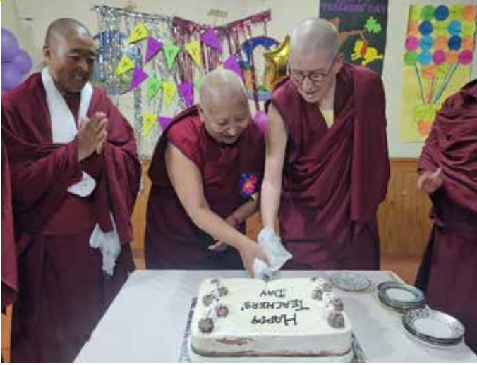
Happy teacher Day september 2022