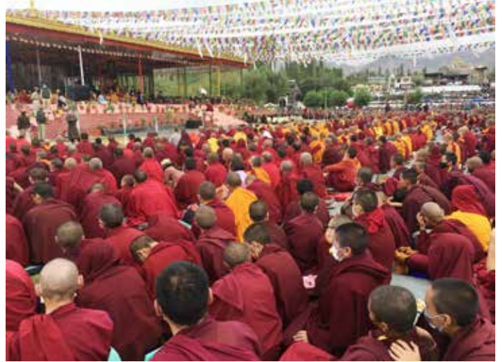
Duizenden aanwezigen bij het onderricht Dalai lama