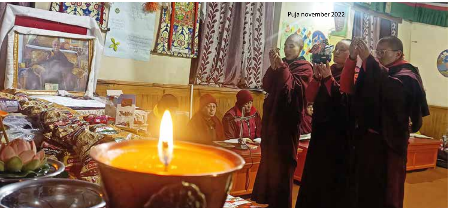
Puja november 2022