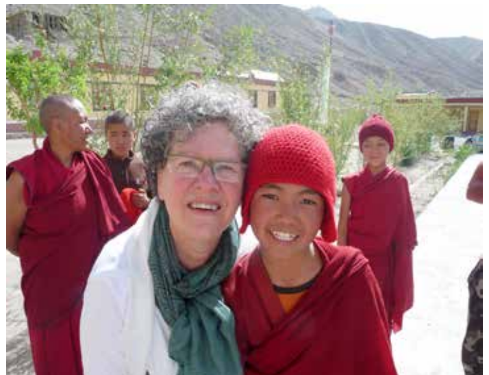
Bezoek aan het klooster in Basgo in 2017