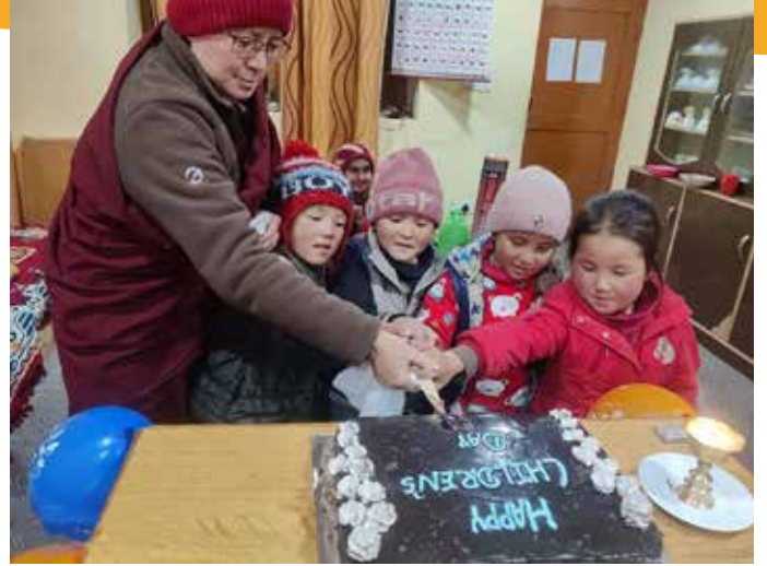
Happy Children Day november 2022