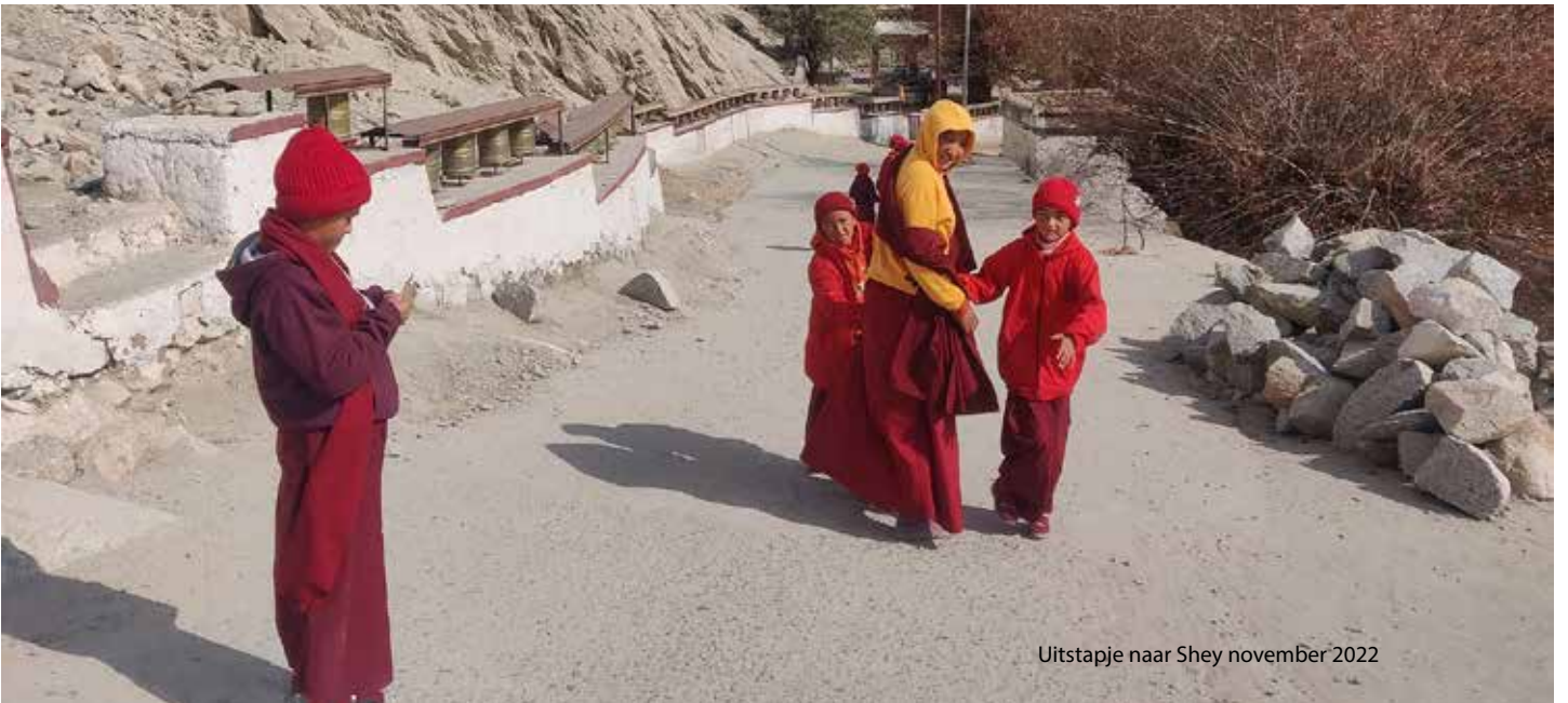
Uitstapje naar Shey november 2022