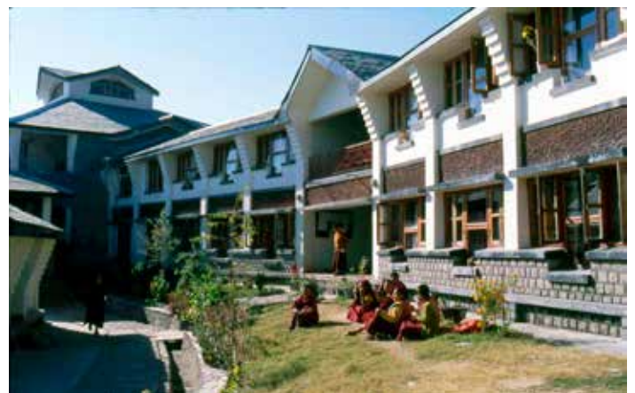
Dolma Ling klooster in Dharamsala