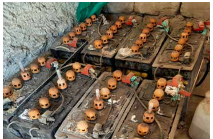
Oude accu's solar system Nyerma

Helpt u mee? Vermeldt als u een extra donatie wilt geven 'Zonnepanelen'. De nonnen zullen blij zijn als ze weer een eigen solarsysteem hebben.