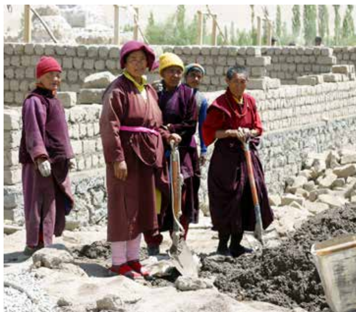
Nonnen bouwen mee aan klooster in Nyerma

In het Gephel Shadrubling klooster in Basgo zijn twee Geshes, die dagelijks onderricht geven in de boeddhistische leer, vooral aan de nonnen in de 'middenleeftijd', dus tieners en twintigers. Er wonen ook jonge lekenmeisjes, die naar de lokale school gaan. Zij worden met zoveel liefde opgevangen dat ze zich thuis voelen.